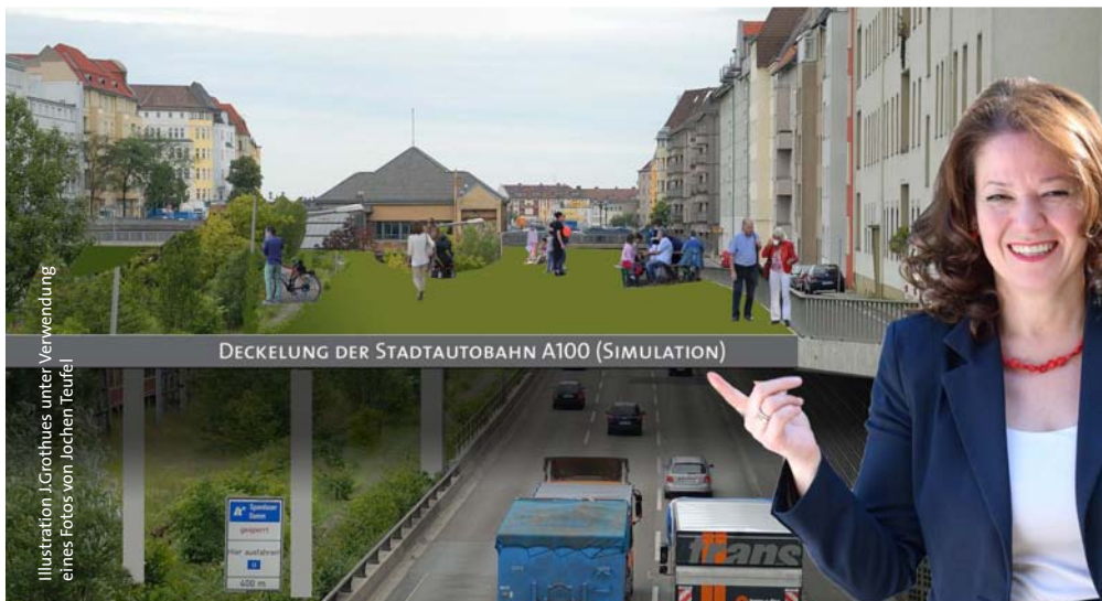
Illustration J.Grothues unter Verwendung eines Fotos von Jochen Teufel

https://www.change.org/p/senatsverwaltung-für-umwelt-verkehr-und-klimaschutz-grün-gesund-gerecht-deckel-auf-die-a100